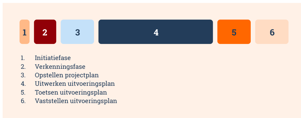
Figuur 1. Een schematisch overzicht van de lengte van de verschillende fasen. De precieze lengte van de fasen en het gehele proces zal verschillen op basis van de lokale situatie.

Iedere fase eindigt met mijlpalen: eindproducten waarover consensus is dat de benodigde stappen zijn gezet. Er zijn afspraken gemaakt over de verantwoordelijkheden en het is mogelijk om door te gaan naar de volgende fase. De fasen zijn maatwerk, maar doorgaans zit de meeste tijd in fase 4. Figuur 1 illustreert dit.